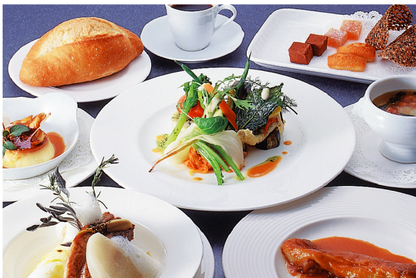
写真はイメージです。

地元の旬の野菜をふんだんに、かつ素材の旨味を引き出した、しつこくなくあっさり上品な仏料理。季節ごとに変わるシェフのこだわりの素材とその職人技に毎回楽しませて頂きます。