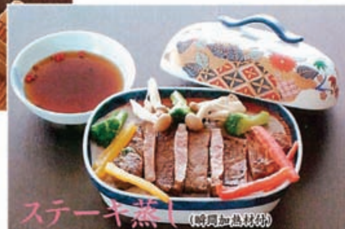
ステーキ蒸し (時間加熱材付)

法要にてご出席いただいたお客様に喜んでいただけるお料理をご提案致します。是非この機会にご賞味下さい。